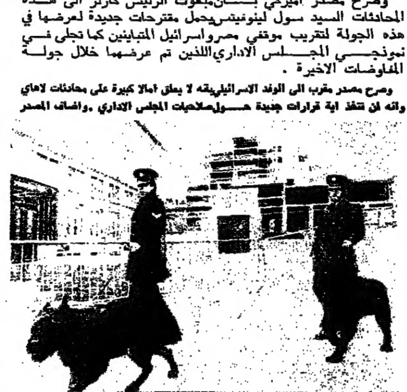
رجال الامن الهولنديون يحيطون بفتى كورهاوس في لاهاي حيث تدور مفاوضات الحكم الذاتي

صرت مقترحة تشكيل ثلاث لجان وزارية لبحث صلاحيات المجلس الاداري